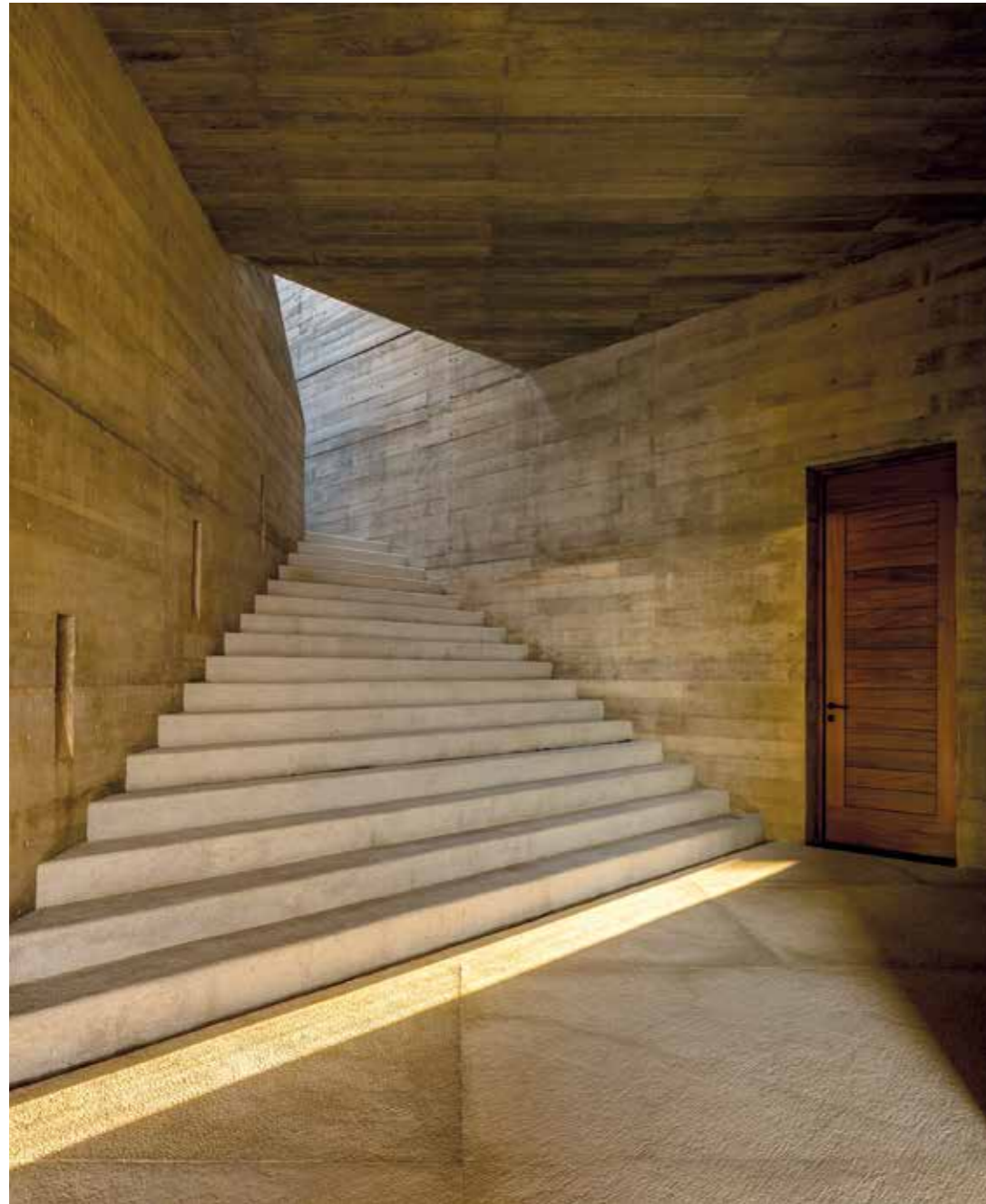
Una escalera de concreto lleva a los dormitorios que ocupan el nivel inferior.