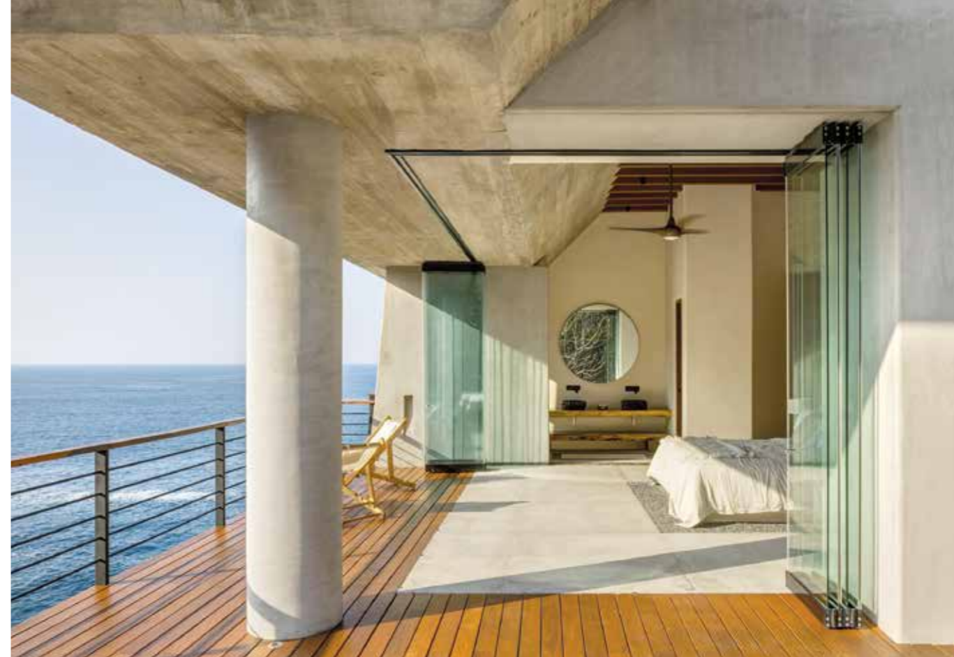
Página anterior La piscina infinita se funde con el tono del océano y del cielo. Esta página Construida sobre riscos, esta vivienda concebida por Zozaya Arquitectos se adapta perfectamente al terreno.